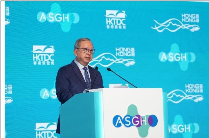
香港貿發局主席 林建岳 博士致歡迎辭。