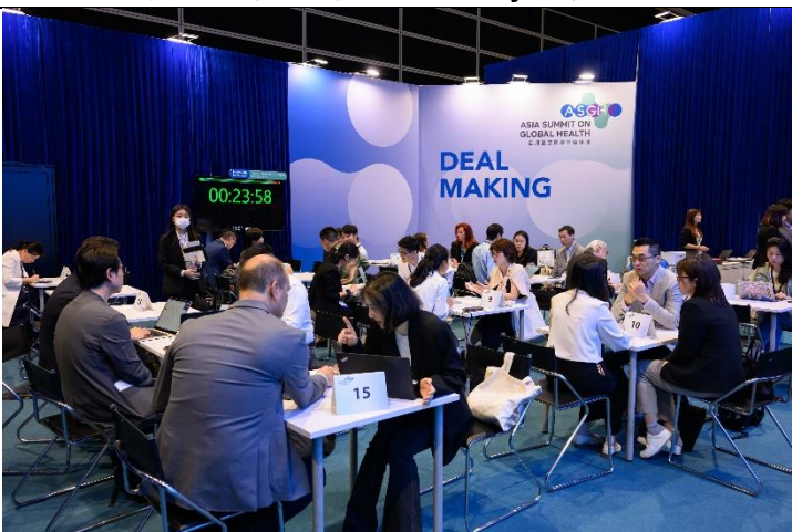
環球投資項目對接環節透過線上或線下一對一會議，為全球各地醫療保健領域搭建國際合作與投資橋樑。