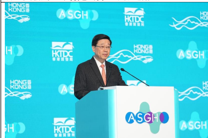
香港特別行政區行政長官 李家超 致開幕辭。