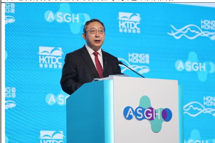
國家衛生健康委員會副主任 曹雪濤 院士發表特別致辭。